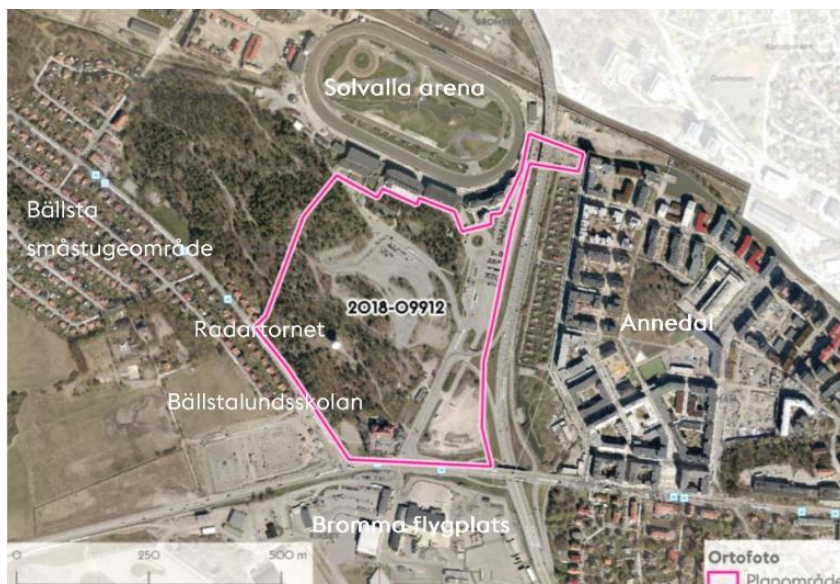
Ortofoto över planområdet och dess omgivning.

Stadsbyggnadskontoret har tagit fram ett områdesprogram för Södra Solvallastaden (dnr 2012-17035) som godkändes av stadsbyggnadsnämnden i augusti 2017. I mars 2019 godkände stadsbyggnadsnämnden en start-pm för detaljplaneläggning. Planen syftar till att möjliggöra ny stadsbebyggelse med cirka 2000 bostäder, service, skola och verksamheter samt en utvecklad, attraktiv entréfunktion till Solvalla arena.